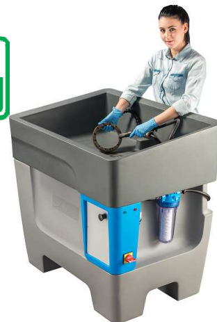
POSTAZIONE DI LAVAGGIO ECO 100