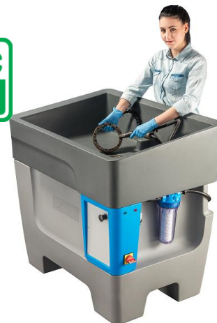
POSTAZIONE DI LAVAGGIO ECO100